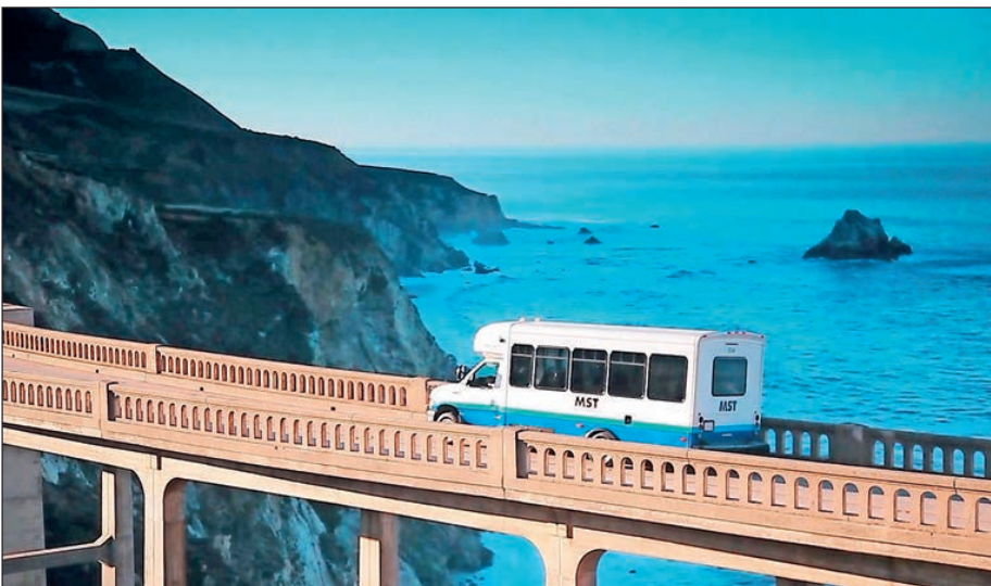
Abb. 1: MST-Midibus auf der touristischen Küstenlinie 24.