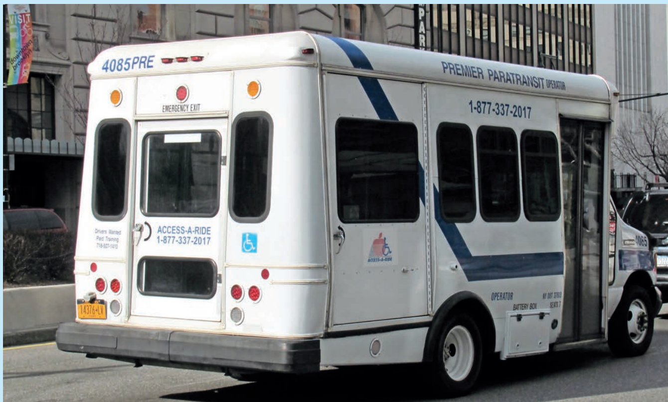
Abb. 3: Paratransit-Kleinbus aus New York mit konventionellem Einstieg im vorderen Teil der Kabine und separater Tür für Rollstuhl- im hinteren Bereich des Fahrzeugs